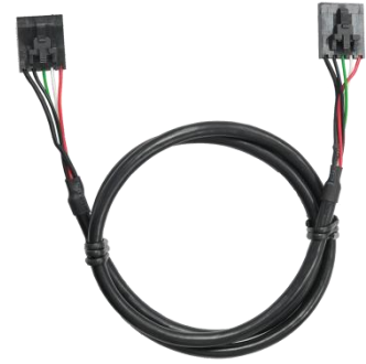
Y05-U2F-060 (ノッチ付 USB2.0 用 5 ピン端子ヘッダーケーブル) x1